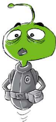
Ilustración Sergi Cámara